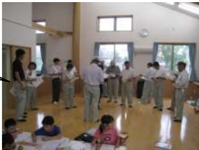
ますほ南児童クラブ