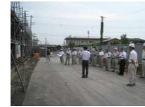
(仮)鵜沢児童センター建設現場