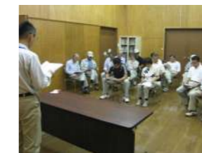
ますほ文化ホール